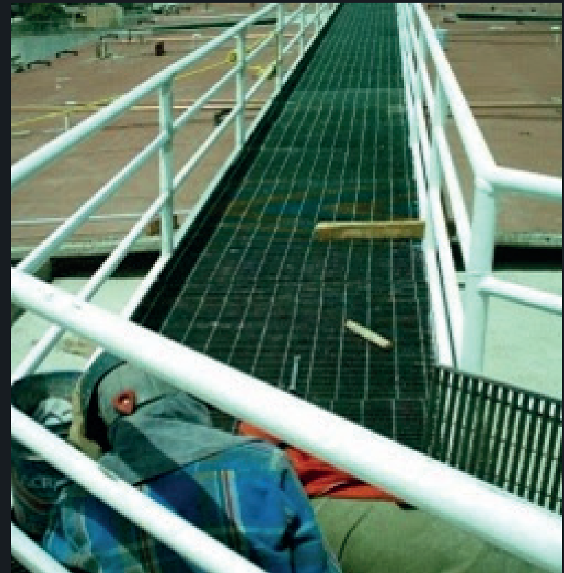
Gobierno del Estado de Chiapas

Construcción de Canchas de Fútbol 7 de Pasto sintético, Instalación Eléctrica, Hidrosanitaria, Alumbrado, Gradas, Planta emergencia, Área de Asaderos, Vestidores Hombres y Mujeres, Oficinas, Barda y Cercado perimetral.