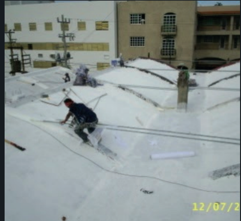
NADRO SUCURSAL VERACRUZ S.A. DE C.V.

Elaboración de proyecto Estructural y Eléctrico para la ampliación del Área de Almacén, Ejecución de la Obra Civil y Eléctrica. Gestoría ante autoridades del Mpio. De Veracruz para Licencias de Construcción y permisos para demoliciones. Construcción de perímetro de almacén Reconstrucción de Estructura metálica para techumbre Instalación de Aislante Térmico en techumbre Ejecución de Obra eléctrica Alumbrado y Fuerza.