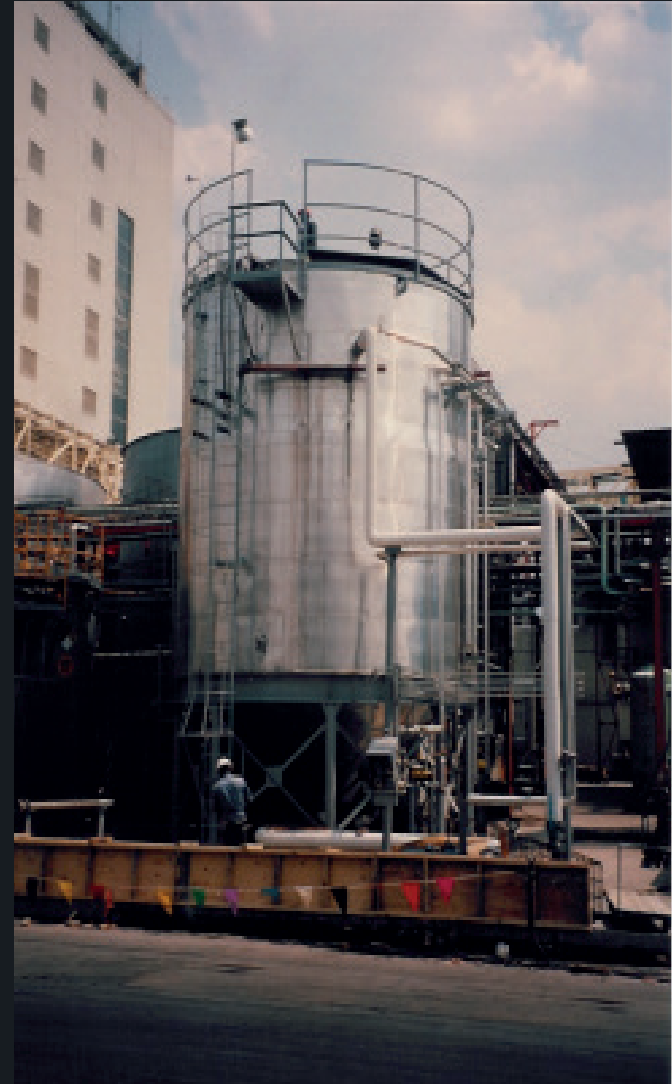
Procter & Gamble de México S.A. de C.V.

Reubicación de tres hornos basculantes de zinc y colocación de extractor de polvo.